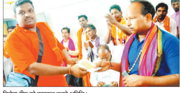
विजेता टीम को पुरस्कर्त कर रहे अतिथि।

कोतबा। ग्राम पंचायत फरसाटोली में आषाढ शुक्ल पक्ष पंचमी तिथि को रथ यात्रा पर रथ नाचा प्रतियोगिता का आयोजन किया गया। कार्यक्रम में रायगढ़ व जशपुर के कलाकारों ने भी भाग लिया।