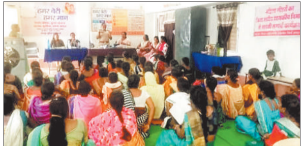
कार्यशाला में भाग लेती महिलाएं।

कांसाबेल। शुरुकार को जीवन विकास संस्था द्वारा महिला प्रकोष्ठ जशपुर के परामर्श केंद्र में 50 महिला लीडरों का जिला स्तरीय एक दिवसीय कार्यशाला आयोजित किया गया।