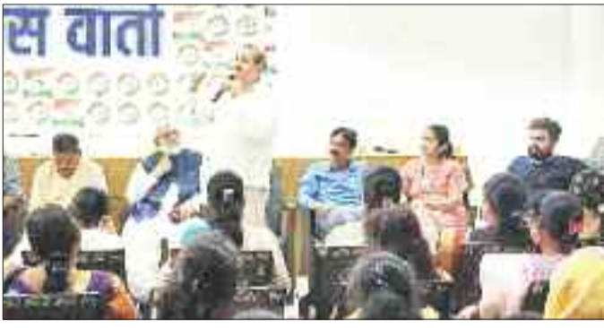
बैठक को संबोधित करते एमआईसी सदस्य।