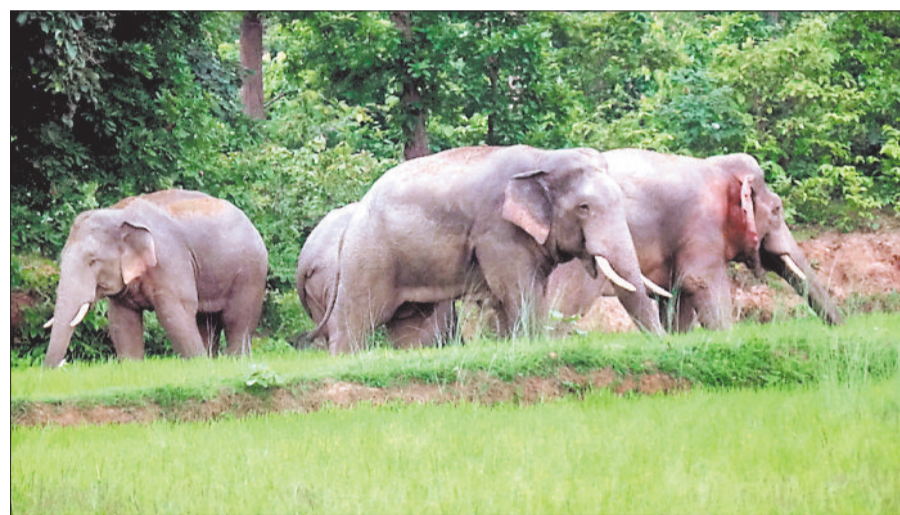
खेत की फसल को रौंदते मतवाले हाथी।

कुनकुरी रेंज के चराईमारा जंगल में दो माह से हाथियों के आतंक से किसानों के फसल निरंतर बर्बाद हो रहा है। ग्रामीण रतजगा करने मजबूर हो रहे हैं। साथ ही हाथियों से सुरक्षा अथवा लोकेशन संबंधी जानकारी देने में असफल रहने के कारण वन अमला की लापरवाही अब भी जारी है। दो माह से चराईमारा जंगल में हाथियों का दल डेरा जमाया है। शाम होते ही रानीकोम्बो क्षेत्र पहुंच हाथियों के द्वारा किसानों के फसलों को नुकसान पहुंचाया जा रहा है इतना ही नहीं हाथियों का दल ग्रामों में पहुंच ग्रामीणों के बाउंड्री दीवारों और बाड़ियों को भी नुकसान पहुंचाया जा रहा है हाथियों के आतंक से बचने ग्रामीण यहां रतजगा करने को भी मजबूर हो चुके हैं। मंगलवार, बुधवार गुरुवार को हाथियों ने शाम 4 बजते ही जंगल से निकलकर खेतों में जमकर उत्पात मचाया है। ग्रामीणों ने बताया कि हाथी प्रतिदिन धान खेत को रौंदकर बर्बाद कर रहे हैं। कई दिनों से लगातार रानीकोम्बो के झोखा बांध में हाथियों ने उत्पात मचा रहा है हाथियों के झुंड ने यहां करीब एक दर्जन से अधिक किसानों के लगभग दर्जनों एकड़ फसल को तहस नहस कर दिया है इस क्रम में मंगलवार की रात हाथियों ने गांव के