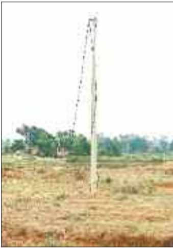
आज तक अधिकारियों द्वारा आमजन की उक्त गंभीर समस्या की ओर ध्यान नहीं दिया जा रहा है। उक्त मोहल्ले में दो महीने से विद्युत आपूर्ति बाधित रहने से लोगों को जहां एक ओर कृषि कार्य हेतु प्रभावित होना पड़ रहा है वहीं दूसरी ओर बच्चों की पढ़ाई भी पूरी तरह प्रभावित हो रही है।

सीमा विवाद का दंश पिछले दो महीने से ग्राम पंचायत कुम्दाबस्ती के डोढगापारा के लोगों को दिवरी युग में जीवन यापन करके भुगतना पड़ रहा है। सूरजपुर व विश्रामपुर विद्युत वितरण केंद्र के अधिकारियों द्वारा एक दूसरे को जिम्मेदार बताकर चोरी गए विद्युत केबल की बजाय अब ईकेबल नहीं बिछाए जाने से विद्युत आपूर्ति दो महीने से गांव में बंद पड़ी हुई है, गांव में अंधेरे की वजह से आमजन को खासी परेशानी का सामना करने विवश होना पड़ रहा है।